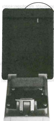
ill. fig. bild 6